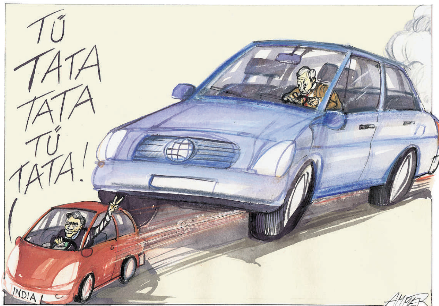
Tekening Wolfgang Ammer

Het Westen heeft nog steeds een blinde vlek voor de stormachtige ontwikkeling van India. Misschien opent de Nano de ogen, hoopt Ashutosh Sheshabalaya.